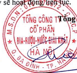
Ngô Quế Lâm